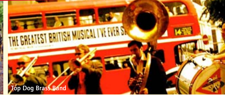
Top Dog Brass Band