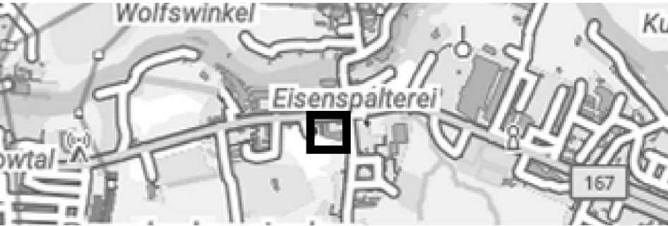
Maßstab 1: 50.000 Übersichtsplan mit eingezeichneter Lage des Plangebiets

(§ 9 Abs. 1 Nr. 1 BauGB i. V. m. § 11 Abs. 1 und 2 BauNVO) WZ 2008 – Klassifikation der Wirtschaftszweige, Ausgabe 2008